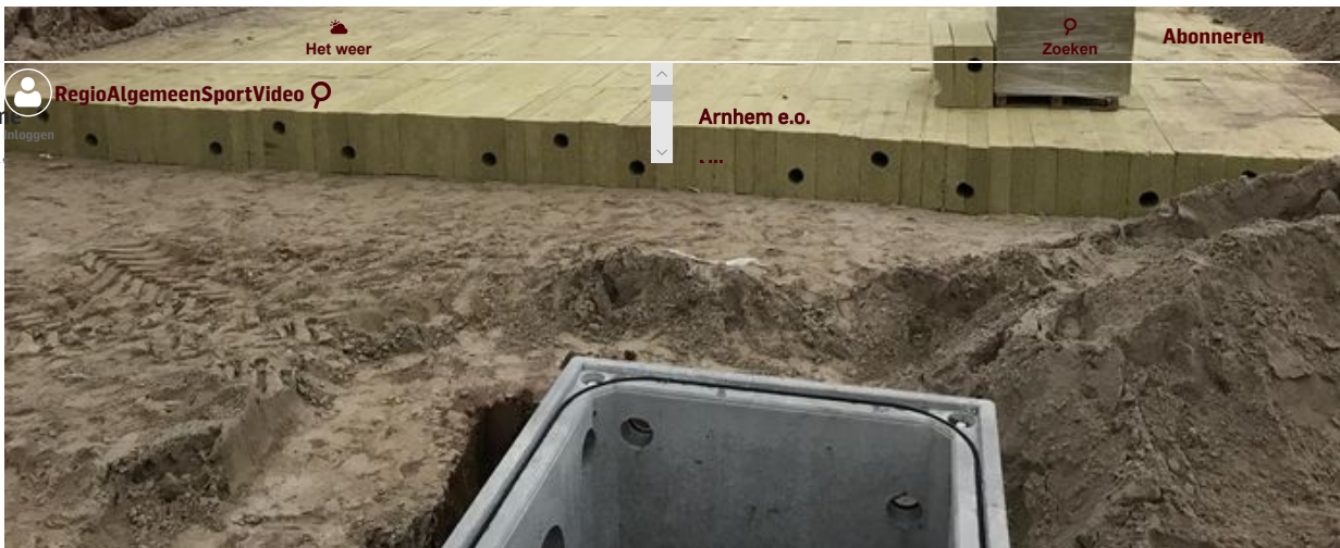
▲ Het pakket van steenwol dat onder de nieuwe bestrating voor supermarkt Jumbo is gelegd.