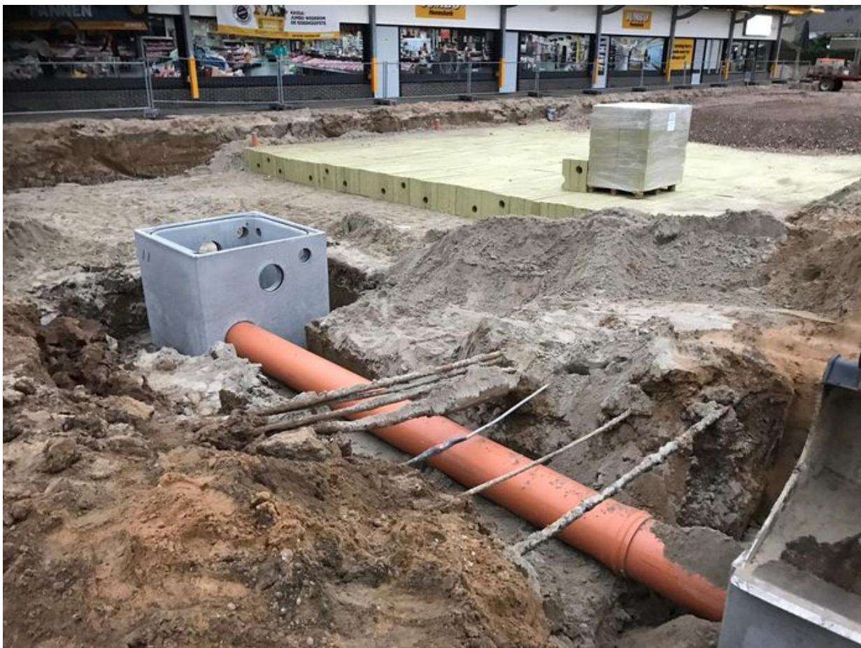
▲ Overtollig water uit de reuzenspons wordt via een leiding afgevoerd.